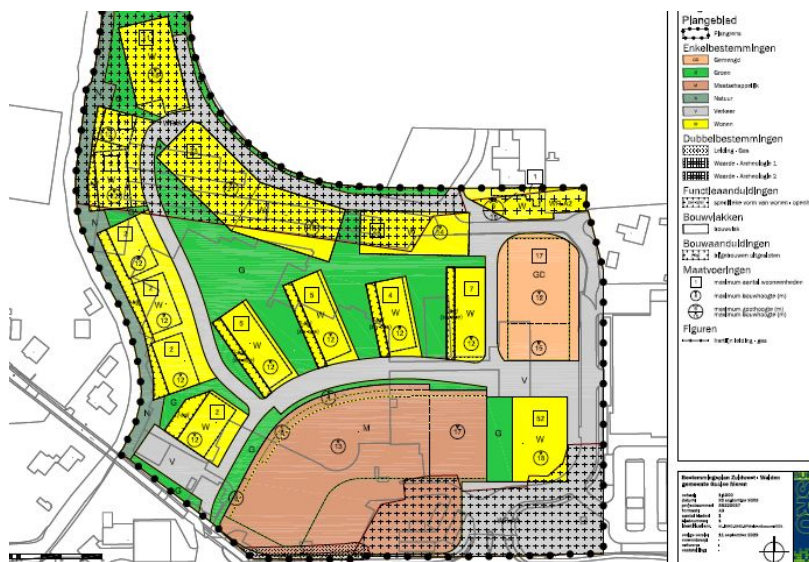
De verbeelding van het nieuwe bestemmingsplan

Op deze wijze beschikt de gemeente over zoveel als mogelijk uniforme plannen.