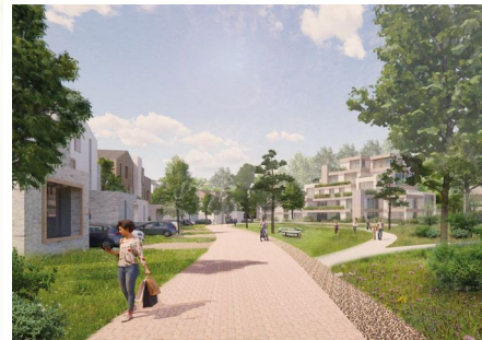
Impressie nieuwe situatie