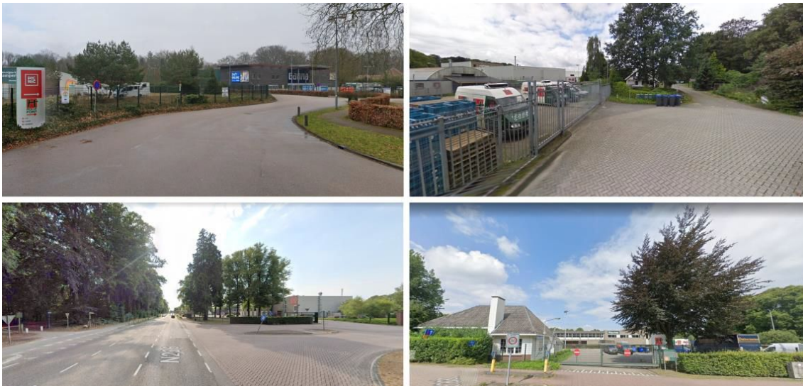
Foto's over de ligging en de bestaande situatie van het terrein

Het overgrote deel van het plangebied bestaat nu uit de bedrijfsbebouwing van het familiebedrijf Hocras, een horecagroothandel en nog enkele andere bebouwing. Het bedrijf is inmiddels verhuisd en niet meer op de locatie actief. Op dit moment zijn er tijdelijk nog enkele bedrijfsactiviteiten aanwezig in het kader van leegstandsbeheer. Aan de westzijde van het plangebied, gelegen tussen de Franse Kampweg en de bedrijfsbebouwing, is een parkeerterrein aanwezig. De rest van het plangebied is voor een groot deel verhard. In het noordelijke deel van het plangebied is een aantal gebouwen aanwezig welke dienen als woningen. Aan de westzijde wordt het plangebied begrensd door het Luye Gat, een kleine watergang die van zuid naar noord loopt. Ook behoort het perceel van de woning aan de Franse Kampweg 24 tot het plangebied.