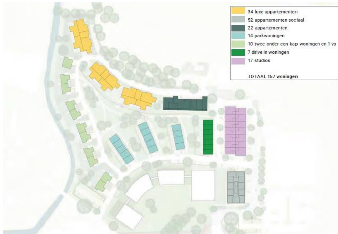
Woningbouwprogramma Walden situatie

52 in de sociale huur worden voorzien. Voorts worden er 17 appartementen gebouwd met op de begane grond ongeveer 14 kleinschalige bedrijfsunits.