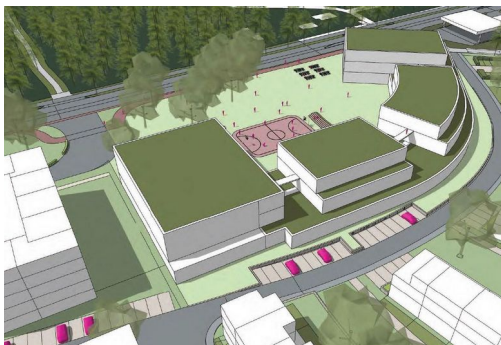
Schetsontwerp van de nieuwe school

De school zal maximaal 4 bouwlagen omvatten en biedt ruimte voor 1200 leerlingen. Het terrein krijgt een groene en diverse inrichting die in samenhang ontworpen zal worden met het omliggende landschap van de woonwijk.