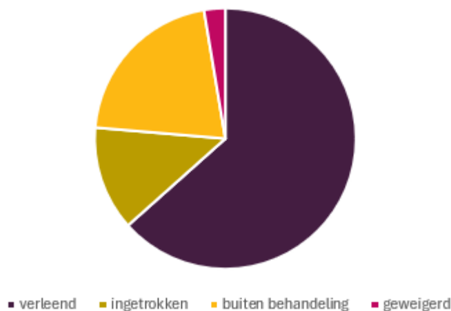
OW vergunningen 2024

Doordat nog niet alle regelgeving eenduidig in het omgevingsplan is opgenomen, was er in 2024 in 34% van de aanvragen sprake van een buitenplanse omgevingsactiviteit (bopa). 66% van de aanvragen past wel binnen het omgevingsplan (opa).