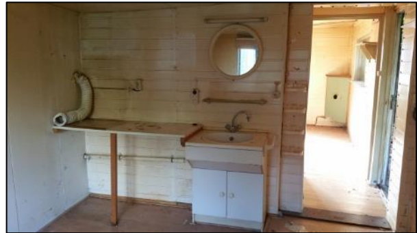
figuur 2.3: overzichtsfoto's gebouw 1