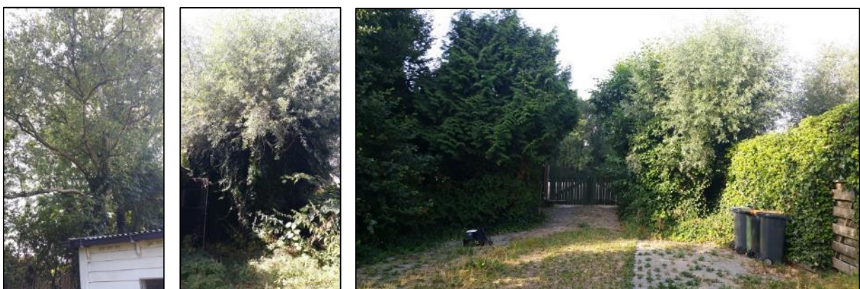
figuur 7.1: grote bomen aan de noordkant van het projectgebied (links), grote wilg ten westen van gebouw 2 (midden) en grote bomen aan zuidkant projectgebied (rechts)

In figuur 7.3 is de aanwezige begroeiing in het projectgebied volgens het boomregister weergegeven, deze begroeiing is van waarde als schuilplaats en potentiële geschikte verblijfplaats. Met name de bomen aan de noordkant langs de watergang, de oude wilg ten westen van gebouw 2, de bomen aan de zuidkant langs het hek en de bomen nabij bunker 1 en 2 zijn van waarde (figuur 7.1 en 7.2).