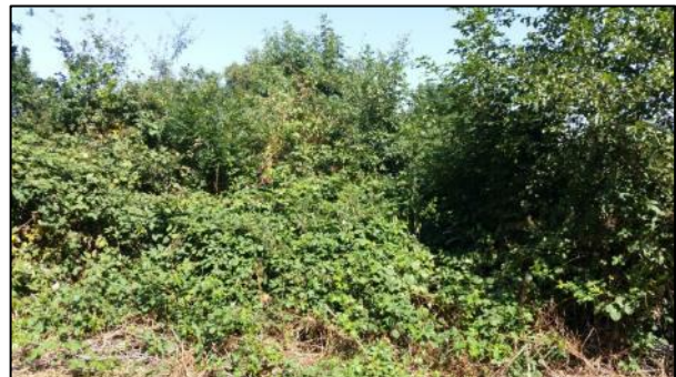
figuur 2.6: foto open plek in de begroeiing (links) en het struweel aan de oostkant van het projectgebied (rechts)