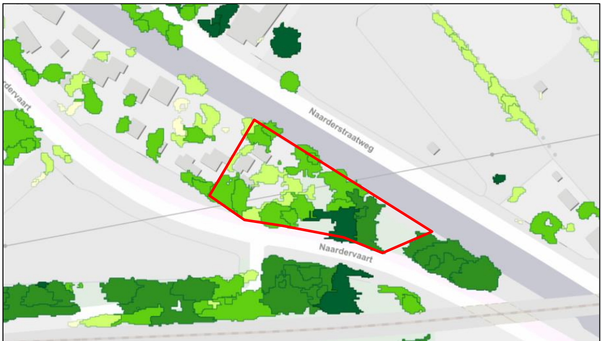
figuur 7.3: ligging van het projectgebied (rode omlijning) en aanwezige begroeiing in het projectgebied