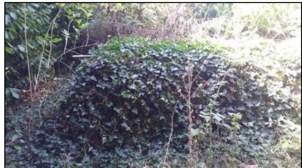
figuur 2.5: foto bunker 2 (links) en een kleine bunker (rechts)