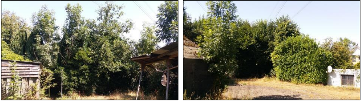
figuur 7.2: aanwezige bomen ten noorden van bunker 2 (links) en bomen ten zuiden van bunker 2 (rechts)