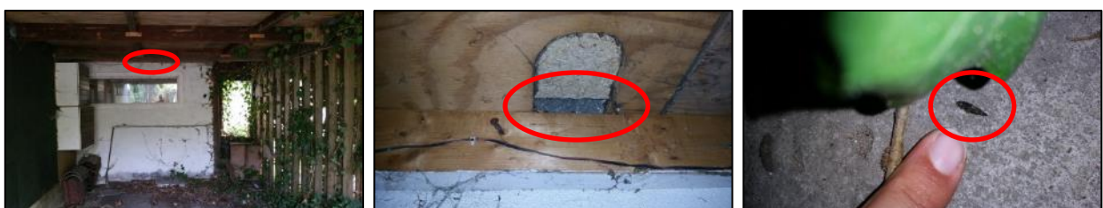
figuur 4.1: mogelijke opening voor vleermuizen (rood omlijnd) en vleermuisuitwerpselen (rood omlijnd) aangetroffen in de overkapping van de garage van gebouw 2

Uit de bureaustudie en de analyse van de verspreidingsgegevens is gebleken dat gewone dwergvleermuis en ruige dwergvleermuis rondom het projectgebied bekend zijn. Tijdens het veldbezoek zijn vleermuisuitwerpselen gevonden onder een opening van de overkapping van de garage van gebouw 2 (zie figuur 4.1).