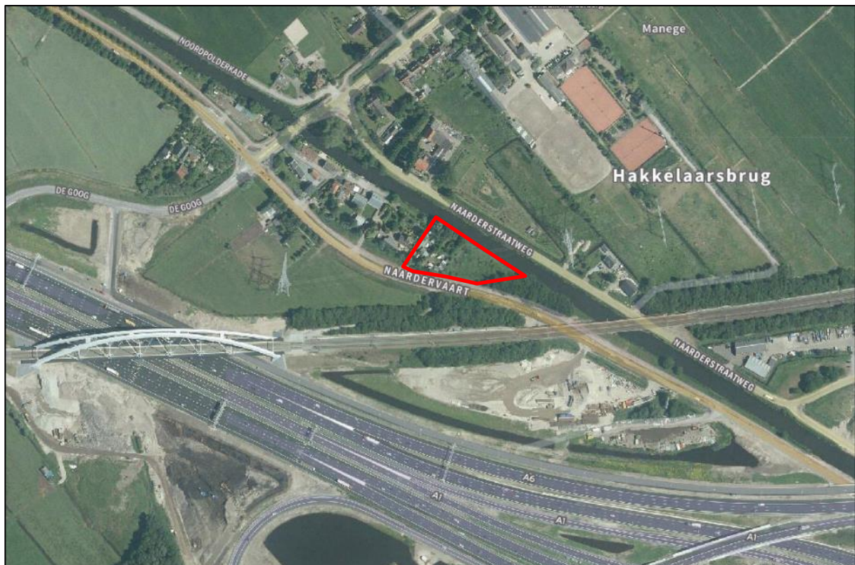
figuur 2.1: ligging van het projectgebied (rode omlijning)

Het projectgebied ligt aan de Naardervaart. De berm langs het projectgebied en de Naardervaart zijn gemaaid. Rondom het projectgebied is een hek aanwezig. Het projectgebied grenst met de noordkant aan de Naardertrekvaart. Ten oosten van het projectgebied is bebouwing met tuin aanwezig en ten westen van het projectgebied is een bosschage aanwezig. Aan de westkant van het projectgebied is een huis met tuin aanwezig. Ten zuiden van het projectgebied ligt extensief beheerd grasland met daarachter de Rijksweg (A1 en A6). In figuur 2.3 t/m 2.6 zijn foto's van het projectgebied weergegeven.