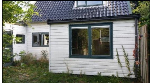
figuur 2.4: overzichtsfoto's gebouw 2