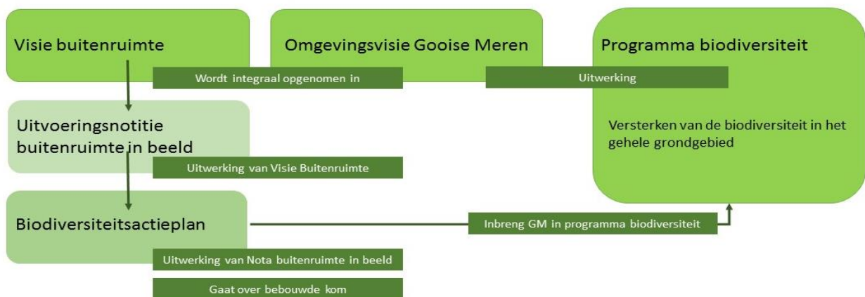
Afb. 2 Relatie tussen Visie Buitenruimte en programma Biodiversiteit.

Het Biodiversiteitsactieplan Gooise Meren betreft alleen het beheergebied van de gemeente en is nodig om natuur en biodiversiteit te borgen in het handelen van onze eigen organisatie. Voor de implementatie van de Omgevingswet wordt geoefend met het opstellen van themagerichte programma's. In zo'n programma wordt aangegeven op welke wijze een ambitie uit de Omgevingsvisie behaald gaat worden. In het kader van onze ambities op het gebied van de biodiversiteit stellen we een programma Biodiversiteit op. Dit themaprogramma geldt voor het gehele grondgebied van Gooise Meren. Samen met andere stakeholders (o.a. Provincie Noord-Holland, Natuurmonumenten, Staatsbosbeheer, GNR, Rijkswaterstaat) onderzoeken we de huidige staat van de biodiversiteit en kijken we naar projecten die deze kunnen versterken. Hierbij vormen de doelsoorten het uitgangspunt, aangevuld met doelsoorten van de gebieden buiten het beheerareaal van de gemeente. De gemeente Gooise Meren brengt hierbij de uitvoeringsnotities Buitenruimte in Beeld en Biodiversiteitsactieplan Gooise Meren in voor het verbeteren van de biodiversiteit in de bebouwde kom.