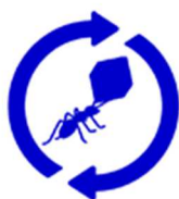
Narrowing the loop: Hoe doen we hetzelfde met minder grondstoffen?