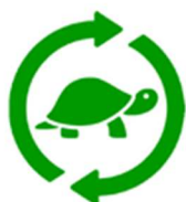
Slowing the loop: Hoe zorgen we dat onze spullen langer meegaan?

De tweejaarlijkse meting maakt het mogelijk dat een circulaire inkoopkalender opgemaakt wordt. Ook voor 2022 wordt bepaald welke opdrachten circulair ingekocht gaan worden.