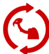
Closing the loop: Hoe zorgen we voor meer recycling?