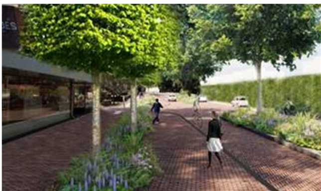
Visualisatie vergroening Vlietlaan

Vanwege capaciteitsgebrek is er een achterstand opgelopen. Het belang van klimaatbestendig denken en handelen bij beleidsvorming en uitvoering van projecten is nog niet volledig ingedaald in de organisatie. In het nationale Deltaprogramma staat dat per 2020 klimaatbestendig handelen onderdeel moet zijn van elke aanpassing in de openbare ruimte en elk beleidsdocument met betrekking tot de buitenruimte. De daarop volgende doelstelling is om per 2050 de buitenruimte klimaatadaptief ingericht te hebben.