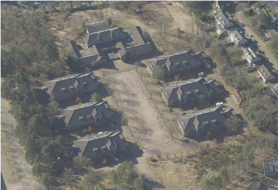
Luchtfoto op 4 maart 2022

De status van gemeentelijk monument wordt toegekend aan de zes gebouwen die momenteel in transitie zijn met toevoeging van de twee schoorstenen van het voormalig keukengebouw. De overige genoemde gebouwen dragen stedenbouwkundig bij aan de ensemble waarde. In de planvorming en ontwerptekeningen zijn de monumentale waarde in de gepresenteerde plannen gerespecteerd. De status wordt dan ook toegekend aan de gebouwen met het voorgestelde visiedocument zoals bij de gemeente Gooise Meren ingediend.